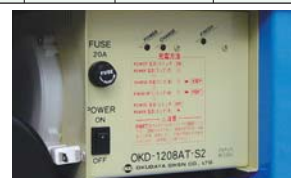
搭載型バッテリー充電器 (AC100V) コードリール付 (コード長さ約1.5m)

※最大積載質量 (kg) は搭乗者を含む積載荷重です。 ※充電器は搭載型自動充電方式 (AC100V)