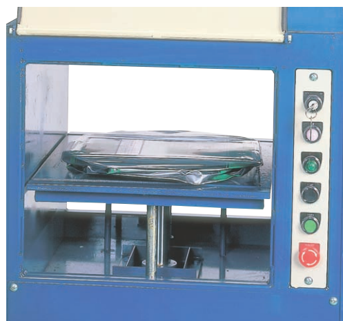
押ボタンを押すだけで簡単にプレス