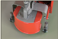
フェンダーバンパー