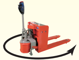
最小回転半径 1620 mm

参考データ：サイクル回数 70 回 (バッテリー新品満充電時、60%放電) 1 サイクルは負荷状態で 10m 走行 + 無負荷状態 10m 走行