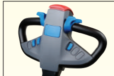
樹脂製走行ハンドル